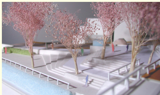
上:熊本駅前広場 下:白川緑の区間