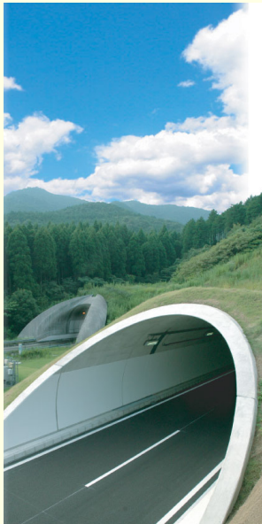
加久藤トンネル坑口デザイン

「加久藤トンネル坑口デザイン」や「熊本駅周辺都市デザイン」、「白川緑の区間」などの景観デザインに携わっている。このような実践活動に基づき、空間と人間活動の関係の解析、模型やCGなどのデザインツールの開発、住民参加やWSなどのまちづくり手法の考察などの研究を行っている。