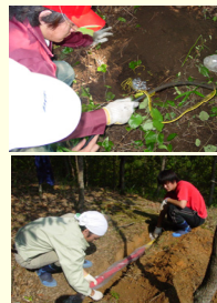
地磁気-地電流法による布田川断層探査(大破碎帯が標高-3000 m付近に存在することを発見)